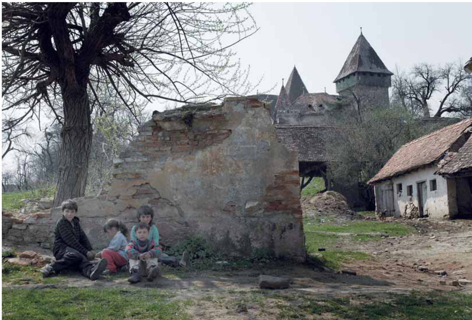
SZÁSZFÖLD, 2010. SZAVAK NÉLKÜL...