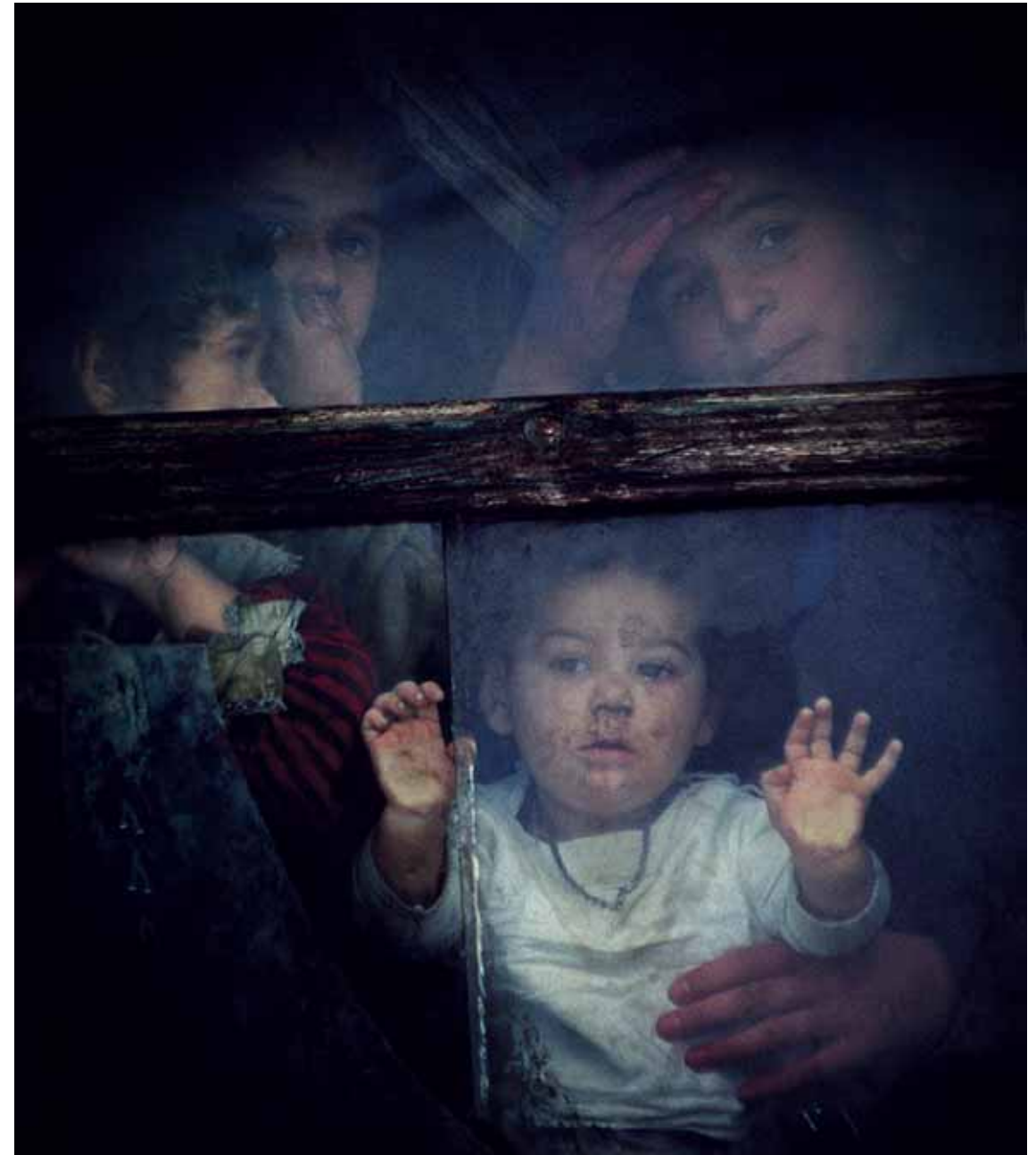
Sokgyermekes roma családok az egykor szászok által lakott házakban